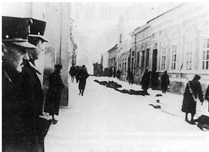
(ez a kép a web-ről, és nem a 2011 szept. 17-i HVG-ből származik)

„Április 8-án a jugoszlávok repülőtámadások egész sorát intézték magyar városok, köztük Szeged, Pécs és Kőrmend ellen. Április 10-én kikiáltották az önálló horvát államot. Ugyanakkor aggasztóan nagy számban érkeztek hírek a szerb bandák erőszakosságairól, amelyeket jugoszláv területen élő magyarokkal szemben elkövettek. Csak ezután adtam ki a parancsot csapatainknak Bácska megszállására. Az volt a feladatuk, hogy az 1918-ban tőlünk elszakított területen nagy számban élő magyarok élet- és vagyónbiztonságát helyreállítsák, és véreinket az anarchia pusztításával szemben megoltalmazzák.” (256. old.) „Hitler azt kívánta, hogy a balkáni háborúban mi is résztvegyünk; ehhez azonban nem járultam hozzá.” (257. old.)